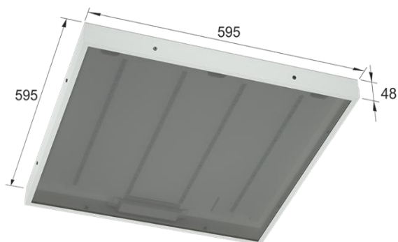
Рисунок 1. Габаритные размеры