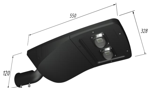
Рисунок 1. Габаритные размеры