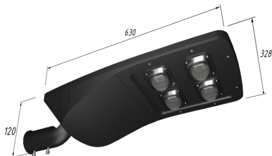
Рисунок 1. Габаритные размеры