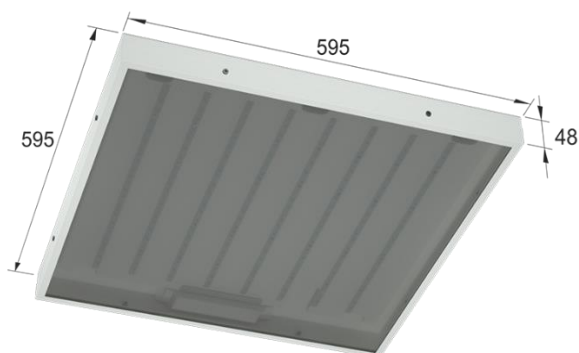
Рисунок 1. Габаритные размеры